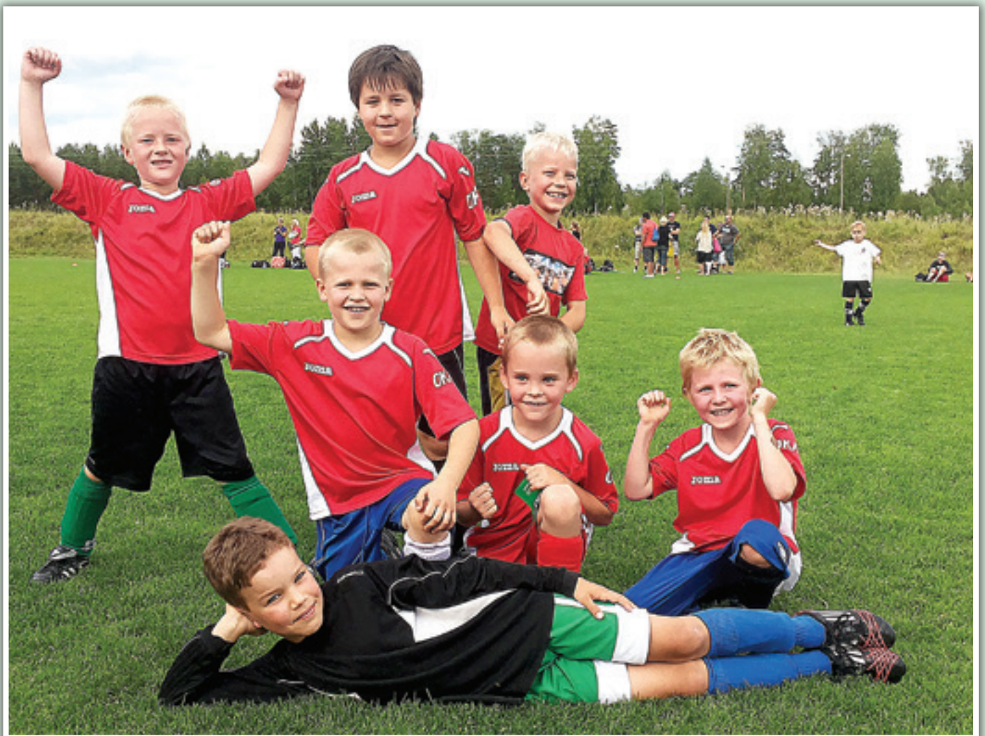
Okan voittoisat juniorijalkapalloilijat (-06) turnaustunnelmissa elokuussa

Jakelu: Ohkolan ja Hyökännummen taloudet