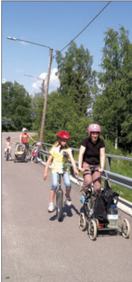
Pienimmät mukanaolijat kulkivat rattaissa yksipyöräilijän työntäminä

Ohkolan sirkuskoulu käynnisti aikoinaan myös yksipyöräilyssä ja muutamia sirkuskoulujen välisiä turnauksiakin järjestettiin. Yksipyöräily voi olla koko perheen harrastus. Yksipyöräilyn