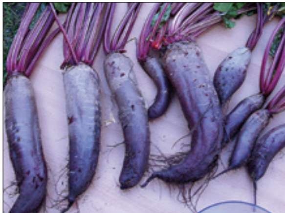
Ainon punajuuret. Pisin, käyrä yksilö painoi 1,304 kg ja pituutta juureksella oli 40 cm.