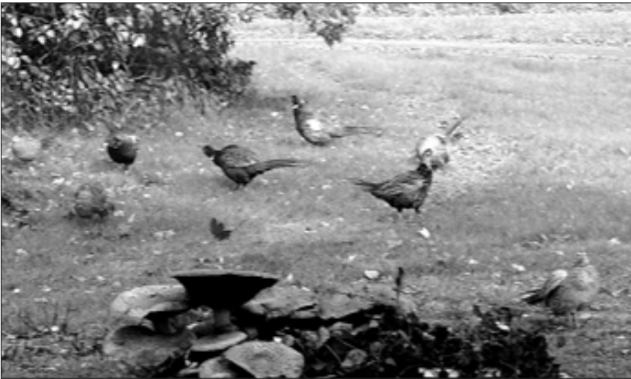
Tuttu näky Ohkolassa, fasaaniparvi