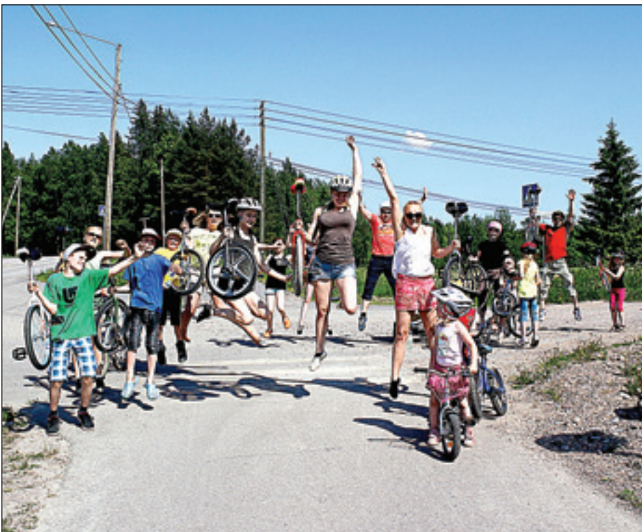
Raittijat järjestettiin kesäkuun alussa. Osallistujia oli n. 40

voi oppia aikuisena aktiivisella harjoittelulla. Monissa sirkusperheissä vanhemmat ovat innostuneet lasten mukana. Isälle tai äidille on hankittu oma pyörä.