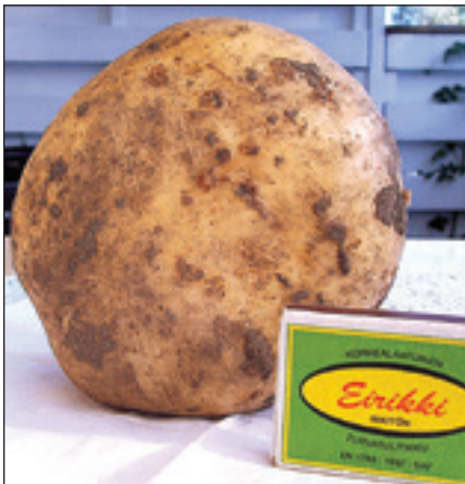
Salmen peruna painoi 0,530 kg

Kesän kuuma keli kasvatti kookkaita kasviksia kotipuutarhoissa. Kekkilän kanankakkako kasvatti kyseiset kasvikset? Kiva kertoa kylälehdessä kaikille kasveista kiinnostuneille kavereille kovasta kasvusta. Kun kokki keittää kattilallisen kevyttä kesäruokaa, kuuluu kaunis kiitos...kyllä kannatti kasvattaa.