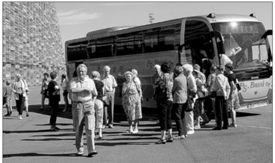
Retkeläisiä Merikeskus Vellamon edustalla Kotkassa