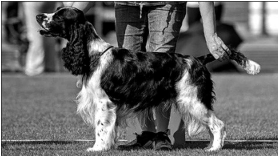
Ohkolalainen 3v.englanninspringerspanieluroos Icycle's Shaggy Dog Story (Milo)

Omasta ja näyttelytoimikunnan puolesta kiitän kaikkia näyttelyyn osallistuneita, järjestäjiä sekä talkoolaisia. Tehdään taas vuonna 2016 Mäntsälän näyttelystä onnistunut ja ihmisten mieliin positiivisella tavalla jäävä tapahtuma.