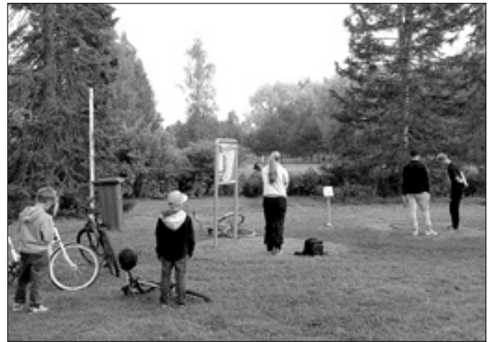
Elävä puisto – paljon väkeä liikkeellä. Kuvassa odotetaan omaa alkuheittovuoroa.

Tervetuloa pelaamaan, pidetään puisto siistinä ja huomioidaan muut puistossa liikkujat! Siisteys on viihtyisyyttä. Rata sopii erityisesti aloitteleville pelaajille, mutta myös kokeneemmille löytyy haasteita. Ohkolan sairaalan puistoa voi kuvailla sanoilla "elävä puisto". Ratahan on vain yksi juttu puiston alueella, se