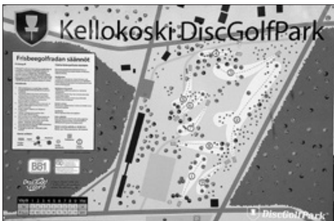
Alkuheittopaikan läheisyydessä on väyläkartta ja säännöt

Jutun haastattelujen pohjalta kokosi Eija Hynninen