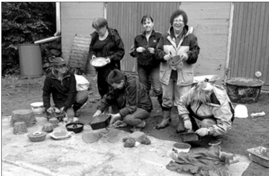
Martat betonitöissä.

Ei edes ajoittainen sade karkottanut Ohkolan marttoja sisätiloihin eikä hidastanut betonitöiden tekemistä pihalla. Kivabetonin ja veden lisäksi tarvittiin sekoitusastia, muotteja, ruokaöljyä muottien rasvaamiseen, lapio ja käsiineet. Betoninsekoittaja oli suureksi avuksi ja pihalta löytyi monenlaisia pikkukiviä ja lehtiä kuvioiden tekemiseen. Suuri raparperinlehti toimi muottina isolle sementtivadille, vanha kakkuvuoka antoi muodon koristeelliselle ovistopparille. Erilaisissa muoviasiastoissa ja maitopurkeissa oli kätevää tehdä palamattomia ja paikallaan pysyviä kynttilöiden ja ulkotulien alustoja. Vanhasta jalkapallosta saatiin helposti pallomuotti. Erityisen kivaa on nähdä, miten pitsiliinoista tehty betonipitsi onnistui. Montaa mukavaa ideaa jäi vielä toteuttamatta, mutta kotonahan voi kokeilla kaikenlaista - betonisäkki ei ole kallis.