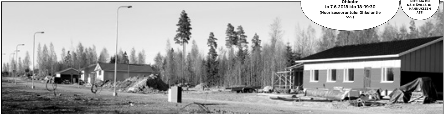
Kuvassa Taruman alueen ensimmäiset kodit