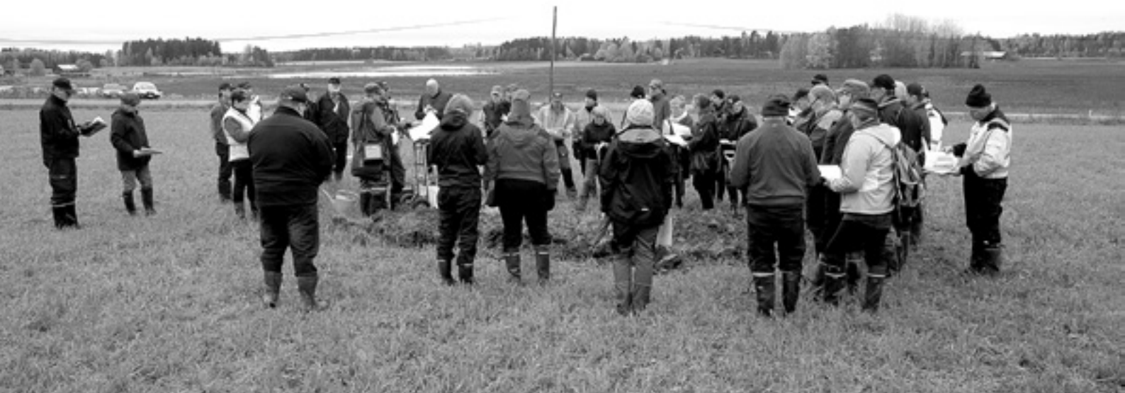
Kuoppatestiin tutustuttiin Tuusulassa pidetyssä pellonpiennartilaisuudessa.