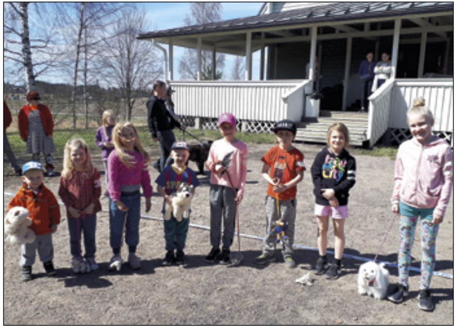
Match Showssa eli koirien harjoitusnäyttelyssä oli myös lelukoirasarja

Vaellusretki toteutetaan 30.7 - 4.8 ja se suuntautuu Pallas - Hetta tunturimai-