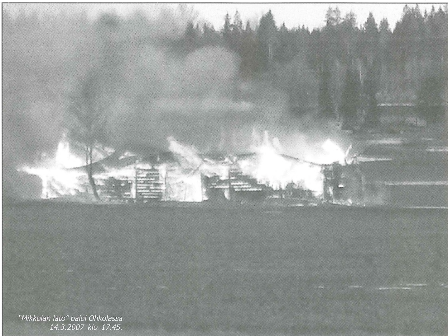
"Mikkolan lato" paloi Ohkolassa 14.3.2007 klo 17.45.

Ohkolan VPK täyttää tänä vuonna 80 vuotta. Rohkenemme pyytää jokaiselta kyläläiseltä lahjaksi sitä, että uhraatte hetken aikaa turvallisuutenne hyväksi ja varaudutte pahimman varalle. Me jatkuvassa hälytysvalmiudessa olevat palokuntalaiset olemme pelkästään hyvillämme siitä, että saamme nukkua yömmе rauhassa, eikä meitä tarvita onnettomuuksien torjuntaan. Turvallista kevät-kesää toivottaa Ohkolan VPK