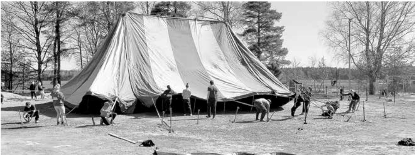
Sirkusteltan pystytys on vaativa talkootyö. Työnjohto on tärkeässä roolissa, yhteistyössä on voimaa.