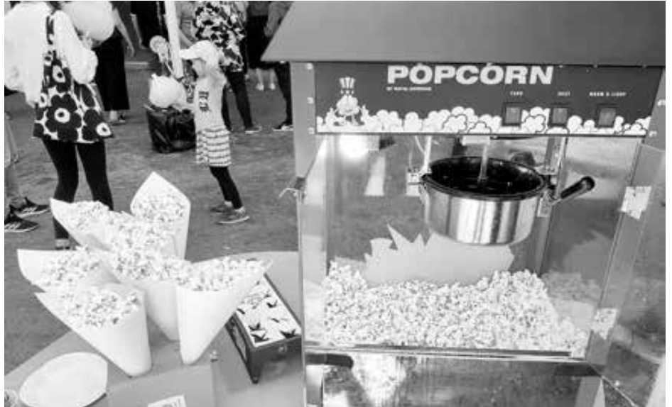
Popcornit ovat yksi suosikki puffetissa.

Itselläni oli tänä keväänä 12. vuosi, jolloin ompelin asuja, letitin tukkaa, lei- voin myytävää, möin lippuja ja auttelin kahviossa. Tänäkin vuonna tapasin tel- talla sirkustuttuja ja jututin minulle näis- sä hommissa uusia ihmisiä. Joidenkin kanssa vaihdetaan jokavuotiset kuulumis- set: Mitäs teidän lapsille muuta kuuluu? Joko on mopokortti ajettu ja kohtakos se peruskoulukin on loppusuoralla? Sirkuk- sessa ollaan näköjään edelleen, kun tääl- lä taasen tavataan. Näistä kohtaamisista, pienestä auttamisesta ja lopulta aivan