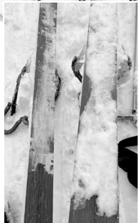
Juuson suksen pohjat