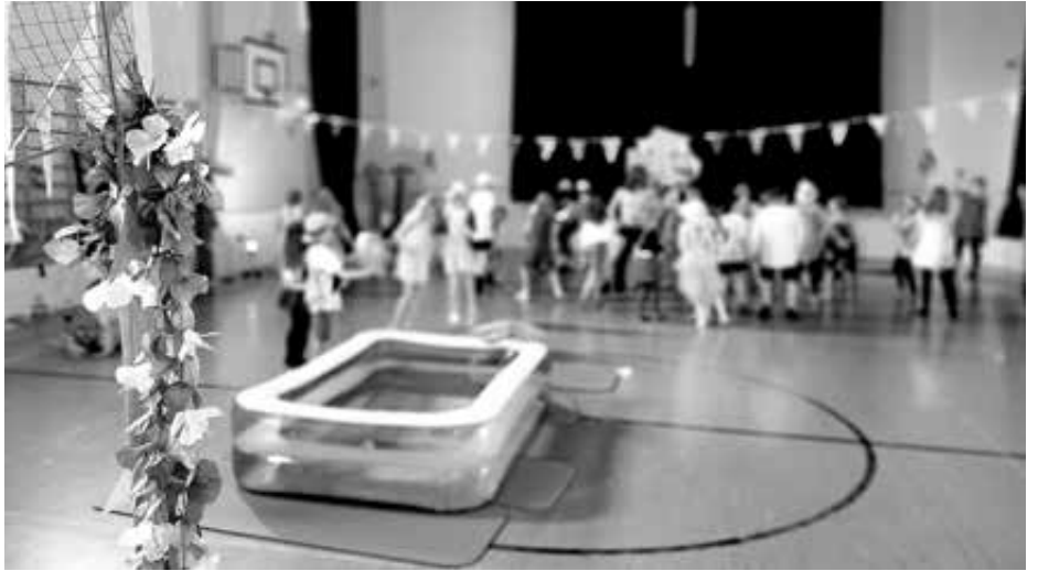
Rantateemainen disko järjestettiin koulun salissa 5.5.