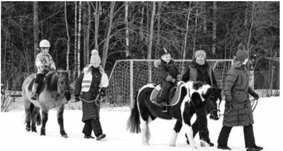
Tuiskun tallin väki toi talviriehaan poniratsastusmahdollisuuden

kuten jalkapalloon ja muihin hankintoihin. Siksi on erittäin tärkeää nähdä teitä kyläläisiä tapahtumissamme, ostoksilla