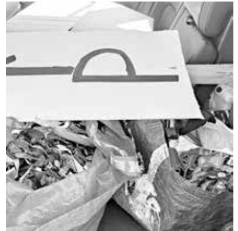
Roudausta on monenlaista: tavaraa, pu- kuja, kylttejä...unohtamatta perheiden panosta lasten kuljettamisessa.