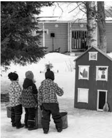
Tarkkuuskisa sankoruiskulla oli kiva kaikenikäisille

Vanhempaintoimikunta toimii koululaisten ja koulun hyväksi. Varoja keräämme stipendien, ruusujen ja luokkaretkitukien lisäksi koulun yhteisiin retkiin/tilaisuuksiin, koulun harrastetarvikkeisiin,