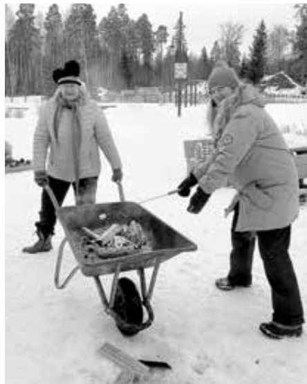
Kottikärryuoitto oli kätevä keksintö