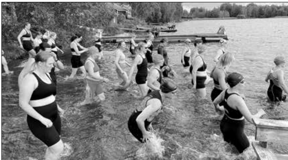
Naisten kuntosarja oli suurin sarja ja meitä oli samaan aikaan lähtemässä uimaan yli 70 uimaria, kun kokonaisuudessaan osallistujia oli likemmäs 300.

Maaliin päästyämme olimme kaikki vaakuuttuneita, että triathlonin harrastus ei jää tähän ja ensi vuonna menemme Hauholle varmasti uudelleen. Suunnittelimme jo treenejä ja taitaa meistä olla jo yksi