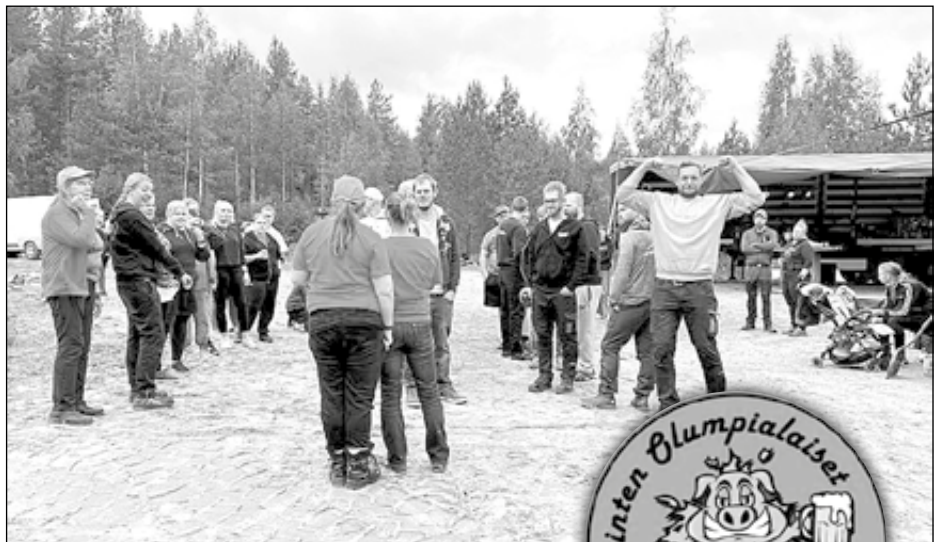
Kisatunnelmaa Ohkola-Kellokoski Olymiadeissa

Kisavoitto on nyt kahtena peräkkäisenä vuonna (2022,2023) mennyt Kellokoskelle. Olympialaispokaali jää aina voittajakylän haltuun. Urheilujuhlan tuntua lisää oheishjelma: Tänä vuonna paikallisista muusikoista koottu bändi syntyi