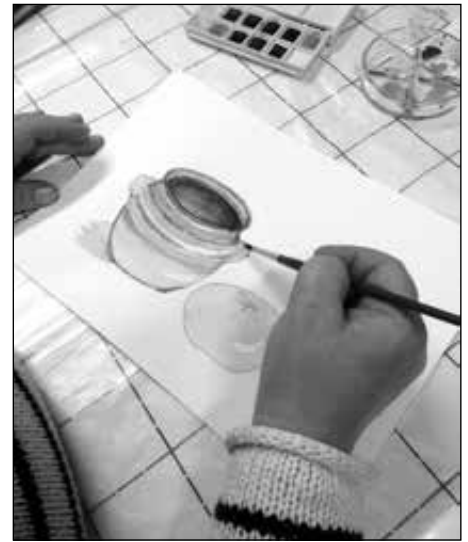
Tämänkin taidon voi oppia