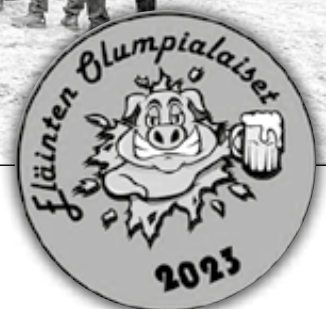
Eläinten olympialaisten virallisen kisapaidan logo vm 2023