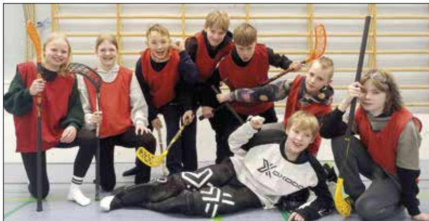
Salibandyturnauksen voittoisassa joukkueessa pelasi 11 Ohkolan koulun viidennen ja kuudennen luokan oppilasta. Kuvassa osa heistä.

— Oli tosi tärkeää saada joukkue kasaan ja päästä pelaamaan turnaukseen. Jännittävimmät hetket koimme viimeisessä ottelussa Sälinkäätä vastaan. Vikan minuutin aikana saimme maalin eikä vastustaja pystynyt enää tasoittamaan, Matias kertoo.