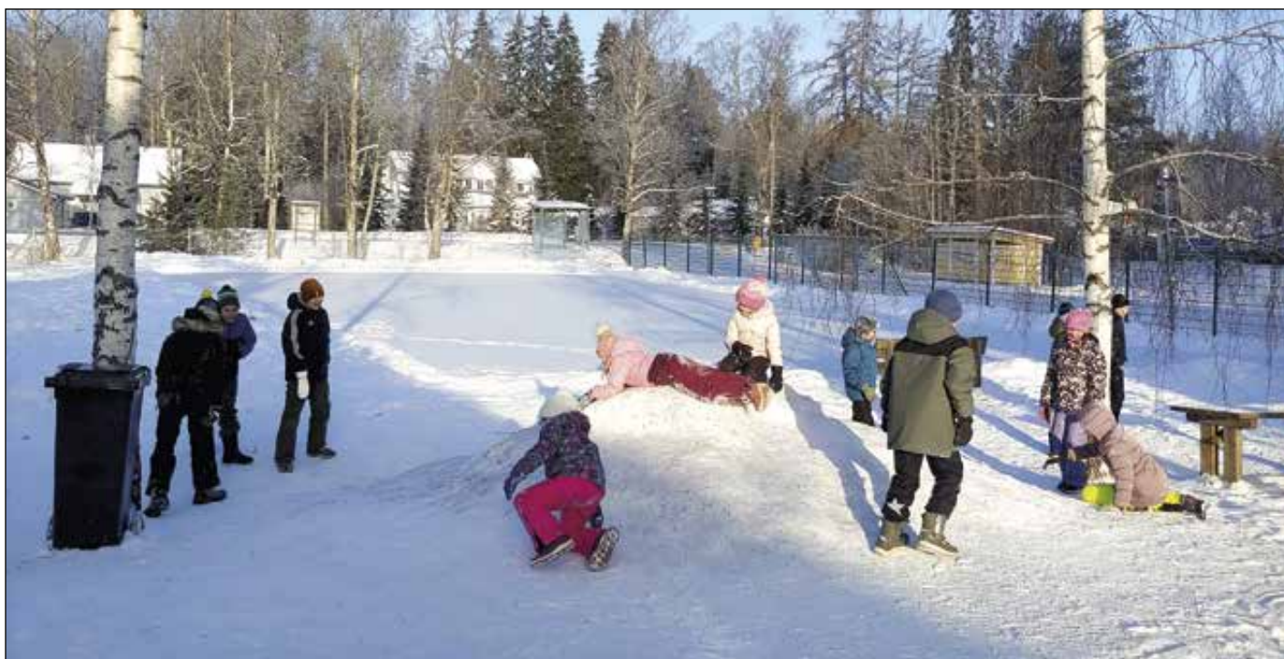
Kauniina talvipäivinä koulun piha on tulvillaan iloa ja kivoja puuhia.