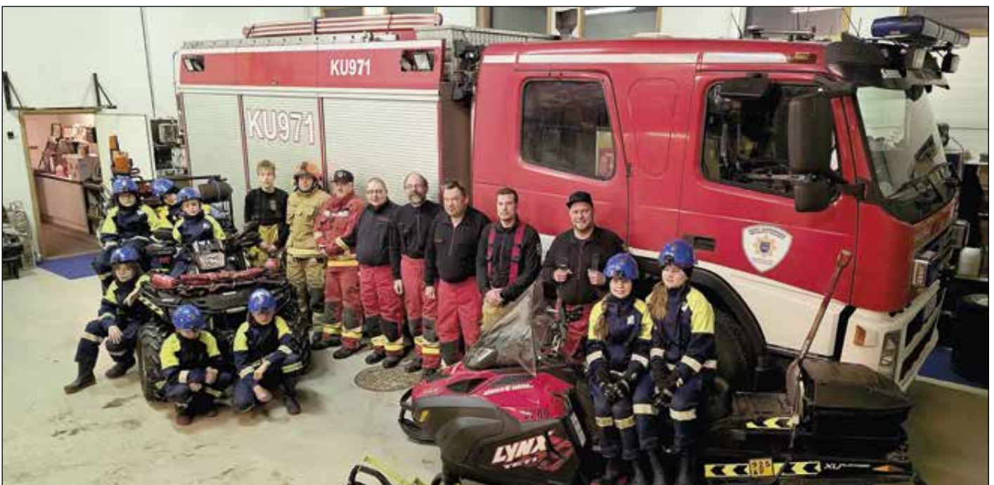
Ohkolan VPK:n palotalli tarjoaa hyvät puitteet hälytysosaston ja nuoriso-osaston viikkoharjoituksiin.

Varautumisen suunnittelu ja toteuttaminen kuuluvat olennaisena osana myös sopimuspalokunnan tehtäviin. Tämä tarkoittaa, että Ohkolan VPK laatii ennakoon toimintasuunnitelmia erilaisia häiriötilanteita ja mahdollisia onnettomuuksia varten sekä huolehtii siitä, että tarvit-