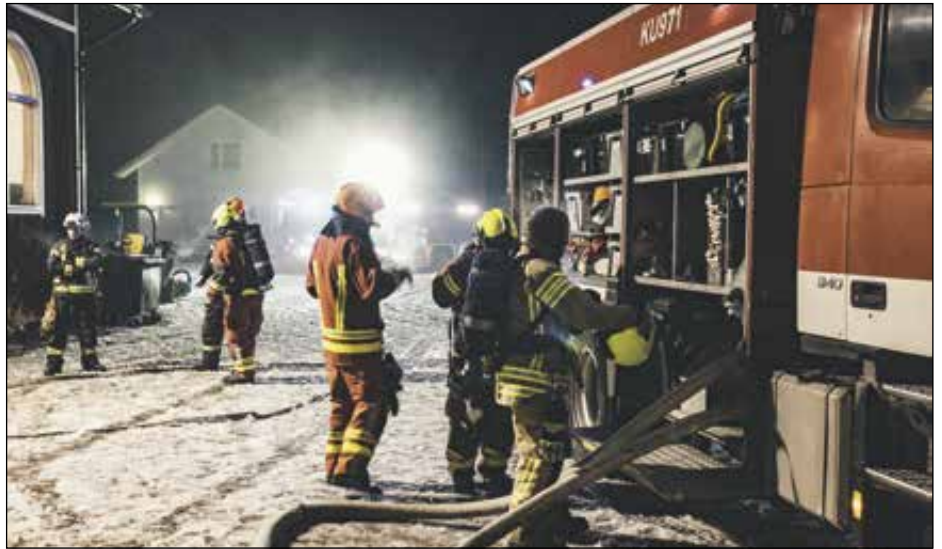
Hälytysosasto harjoittelee.

Ohkolan VPK:n toiminta perustuu vahvaan yhteisöllisyyteen. Tänäkin osa jäsenistä osallistuu paloaseman huoltoihin ja varusteiden tarkastuksiin. Tal-